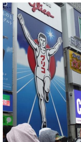
心齋橋：グリコ看板